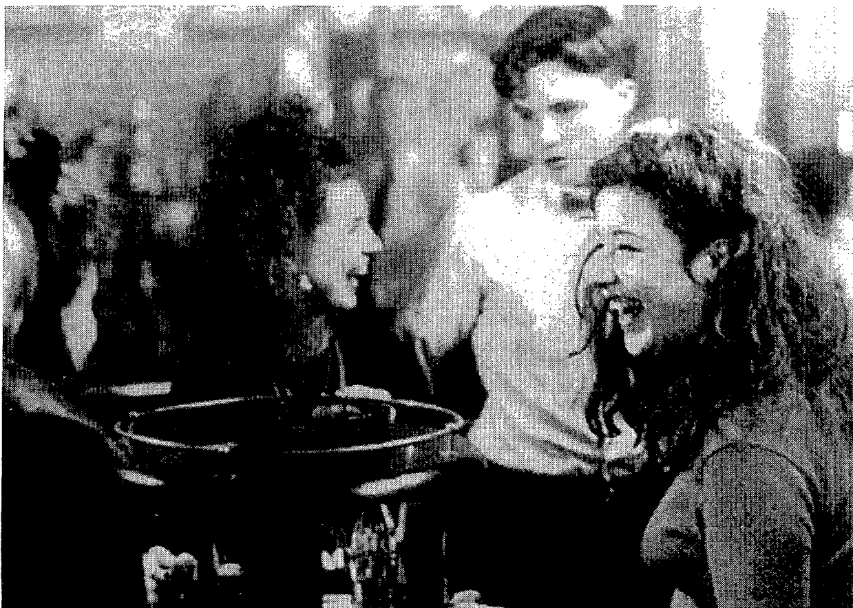
El último filme de Frears trata de los problemas que causa en una familia el embarazo de la hija mayor

■ El director de "Mi hermosa lavandería" y "Ábrete de orejas" presentó en la Seminci "The snapper", una alocada sátira sobre la lucha por la supervivencia de la clase obrera, que aparece ya como la más firme candidata al máximo galardón que concede el certamen vallisoletano